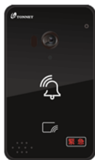
TVI3356 IP型緊急對講機(薄型)